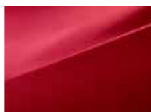
TWR Cool red