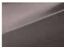
PSW Cashmere brown