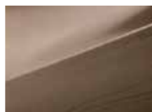
P5P Satin amber