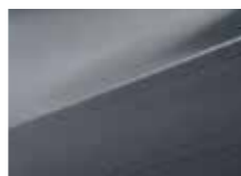
ZAR Steel grey