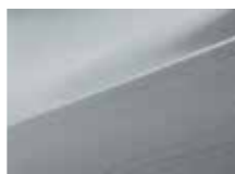
RAH Sleek silver