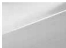
TCW Creamy white