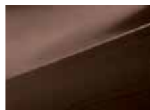
WB4 Cool brown