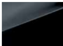
PAE Phantom black