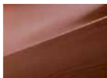
U8P Hazel brown