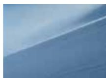
XAF Ice blue