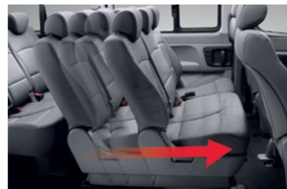
Продольная регулировка сидений второго ряда