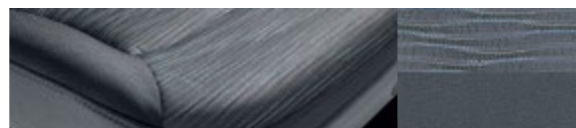
Ткань Woven GL