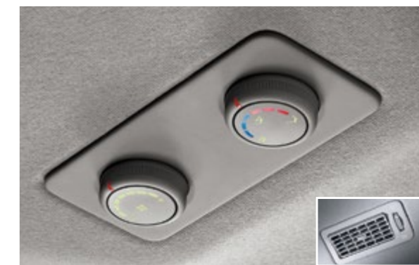
Для пассажиров, находящихся на задних сидениях автомобиля, предусмотрены два вращающихся регулятора температуры и режима работы вентилятора.