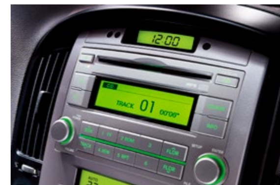
Н-1 предлагает топовую аудиосистему, которая включает в себя радиоприемник, CD-плеер и MP3-плеер.