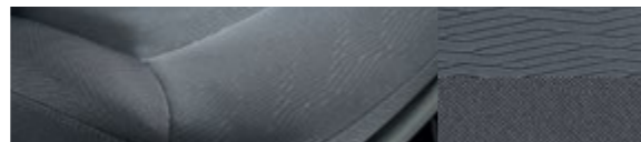
Ткань Tricott Suede GLS