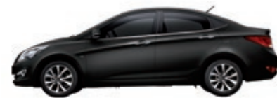
Черный перламутр (MZH)