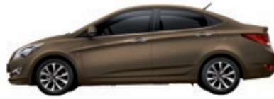
Коричневый перламутр (VC5)