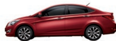
Красный гранат перламутр (TDY)