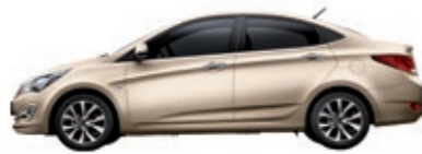
Бежевый металлик (M2B)