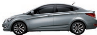
Серый металлик (SAE)