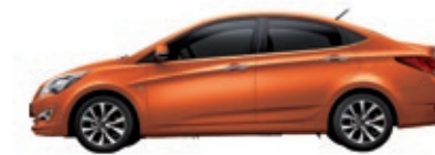
Оранжевый перламутр (R9A)