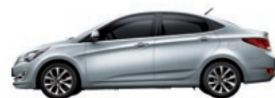
Серебристый металлик (RHM)