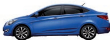
Синий перламутр (ZD6)