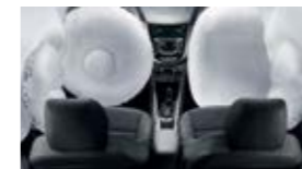
6 подушек безопасности