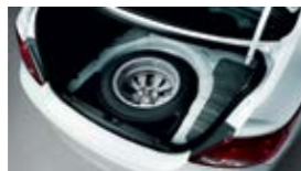
Полноразмерное запасное колесо