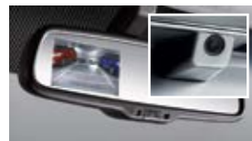
Камера заднего вида