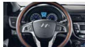
Руль с подогревом

Безопасность пассажиров во время поездки — вот главный стимул, побуждающий наших специалистов совершенствовать технологии и разрабатывать новейшие системы безопасности. Детальная проработка каждого элемента Hyundai Solaris позволила создать автомобиль, который защитит вас от опасностей на дороге.