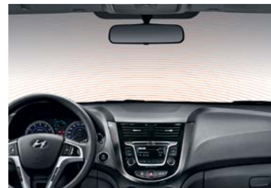
Подогрев лобового стекла